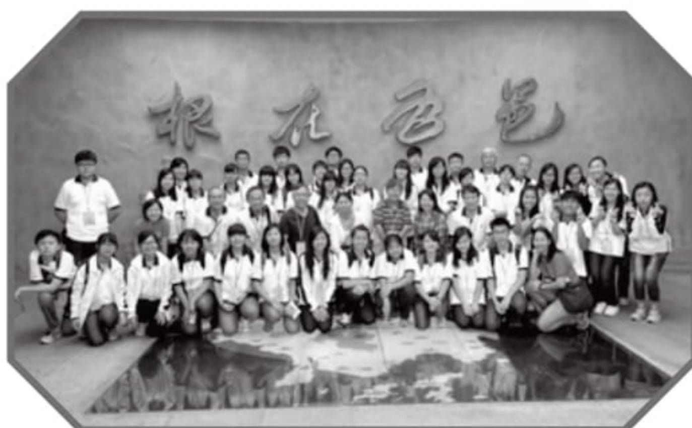
開平參訪團大合照