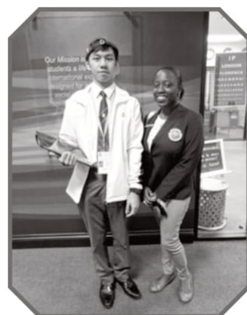
范同學到美國 Pepperdine University 交流留影