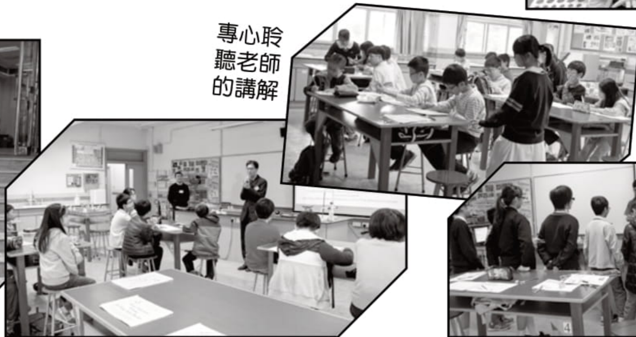
林校長親自歡迎參與課程的小學生