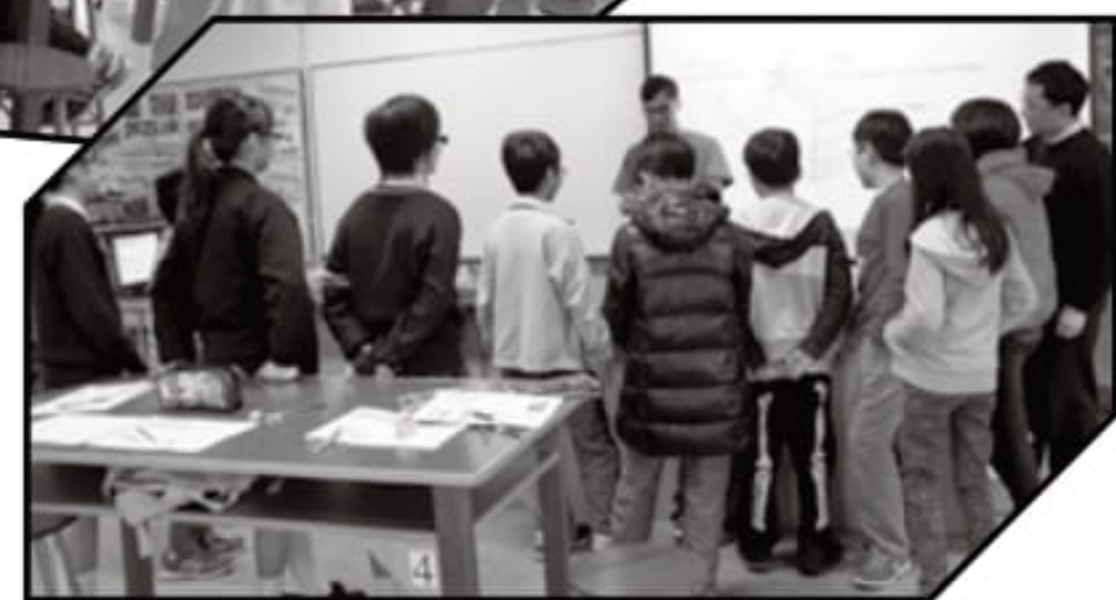
仔細觀察實驗現象