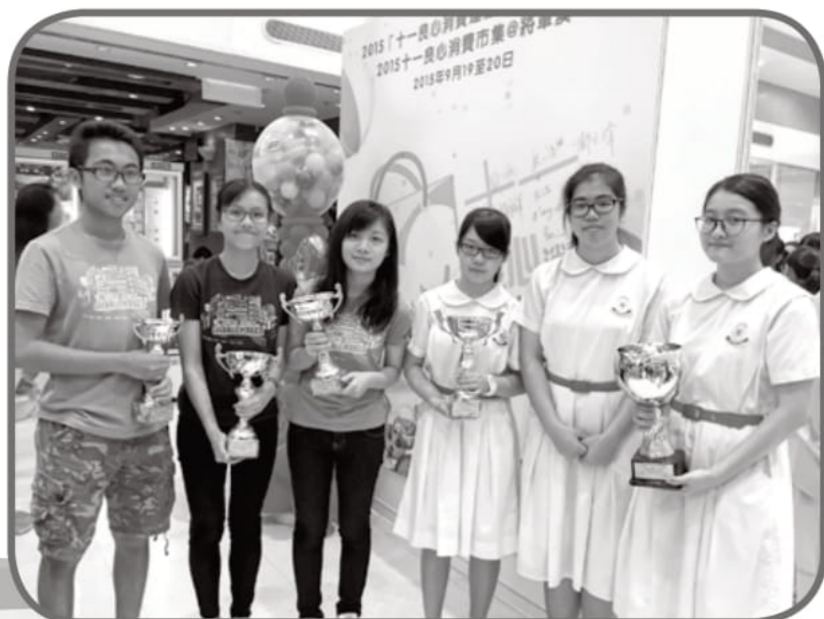
本校同學在社創校園通通識獲得多項大獎