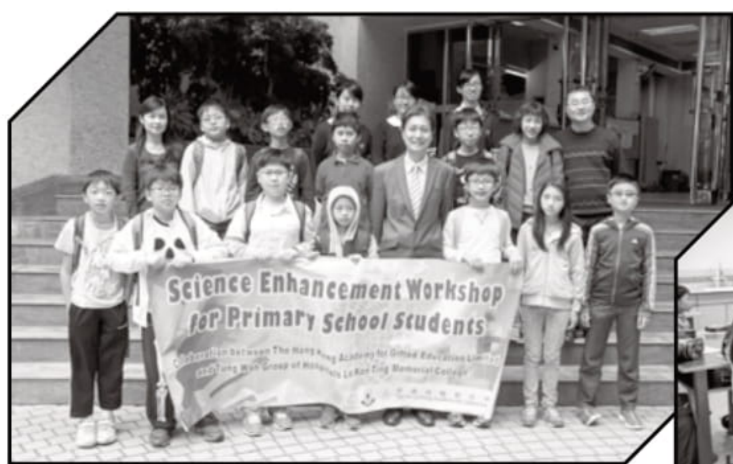
林校長，陸濤老師，學生助理員與參與課程的部分小學生合影