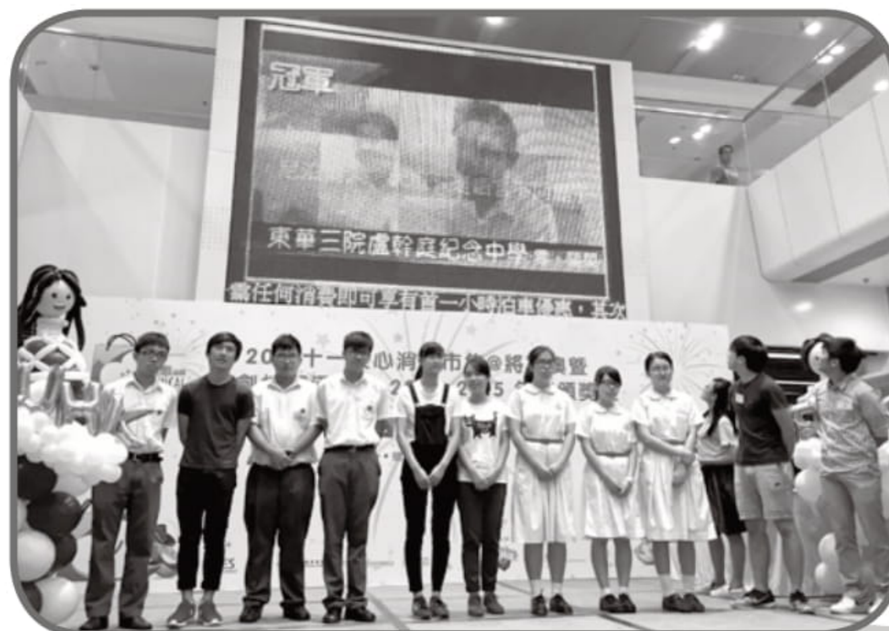
社創校園通通識·短片創作比賽的冠軍公佈時刻