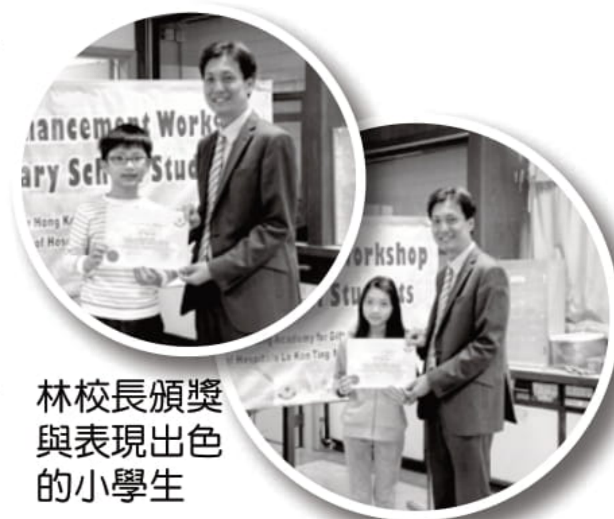
林校長頒獎與表現出色的小學生

參與課程的學生來自小五至小六香港資優教育學苑學員，遍佈全港不同的小學，包括：浸信會呂明才小學，基督教國際學校，聖公會仁立紀念小學，宣道會劉平齋紀念國際學校，元朗商會小學，聖瑪加利男女英文中小學，博愛醫院歷屆總理聯誼會梁省德學校，聖公會靈愛小學，東華三院李東海小學，基督教宣道會徐澤林紀念小學，聖公會基恩小學，香港路德會增城兆霖學校，佛教林炳炎紀念學校。