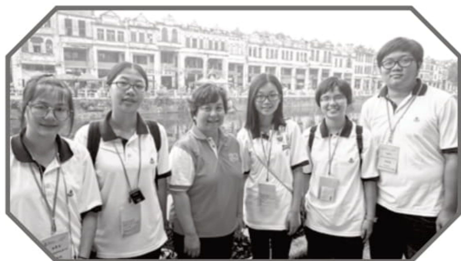
開平參訪團同學在赤坎古鎮與本院主席合照