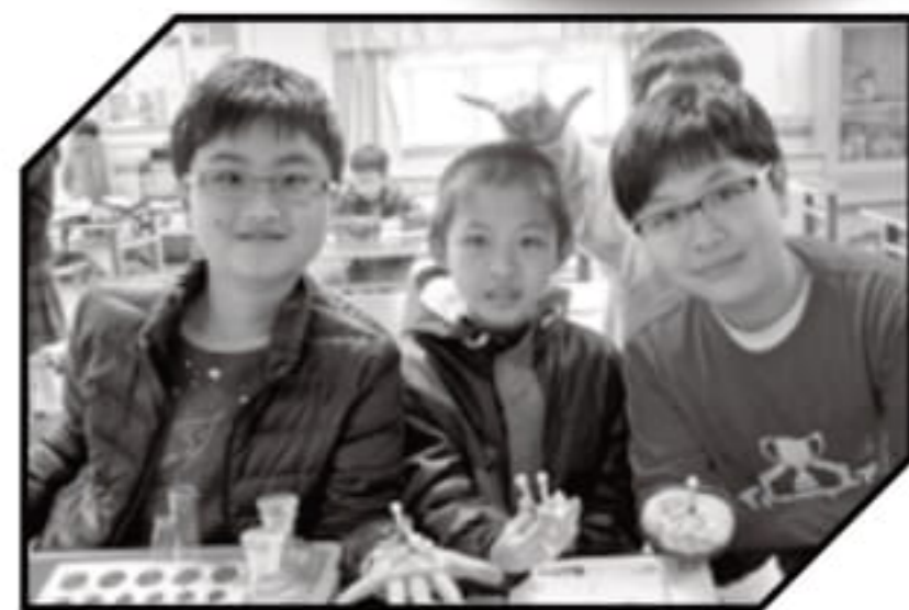
開心展示自己的成果