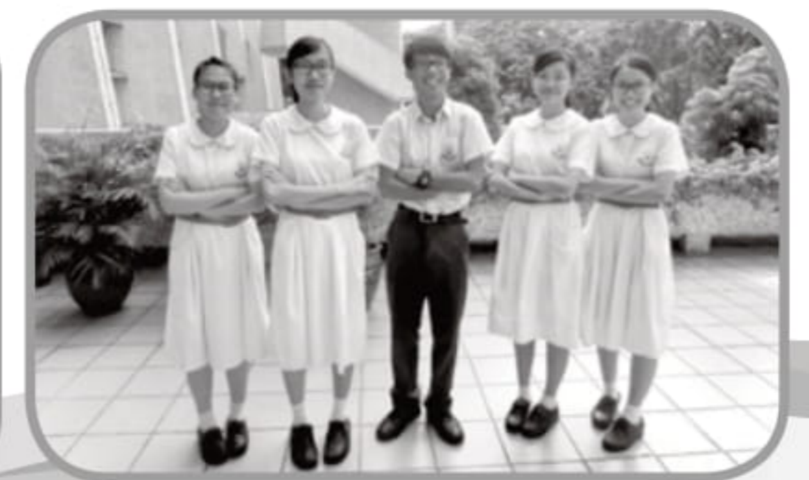
扶輪決賽幕後英雄 2015