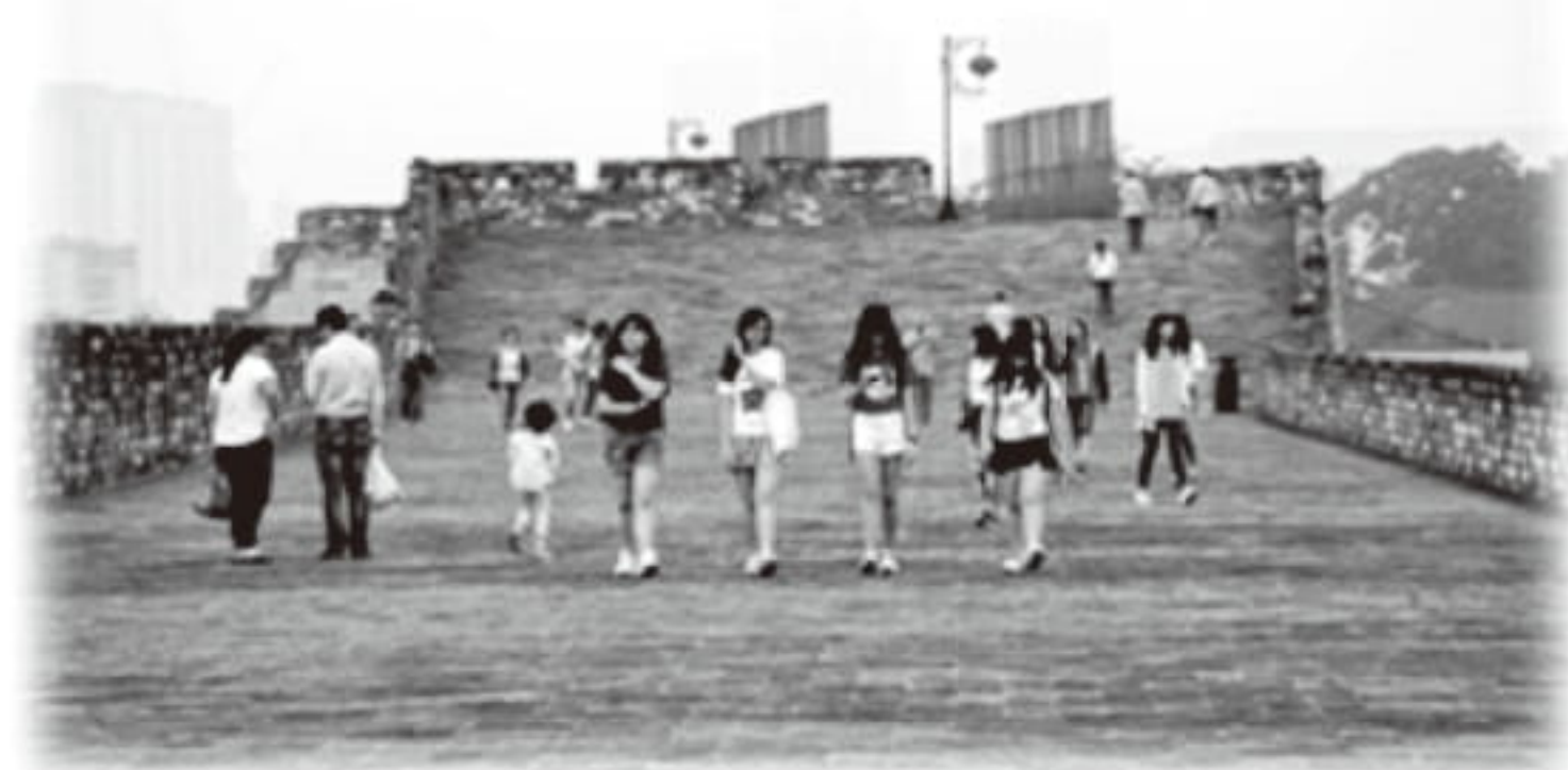
中華門上的「小長城」

除了感受古城氣氛，此行也令我對中國歷史認識更深。第二天，我們到了侵華日軍南京大屠殺遇難同胞紀念館。那裡的氣氛十分莊嚴肅穆，大家都懷著一顆悲痛的心認真、細心地看每件歷史遺物，咀嚼每句每字的描述。這段沉重的歷史，也教我了解到和平的可貴，及牢記歷史、吸取教訓的必要。