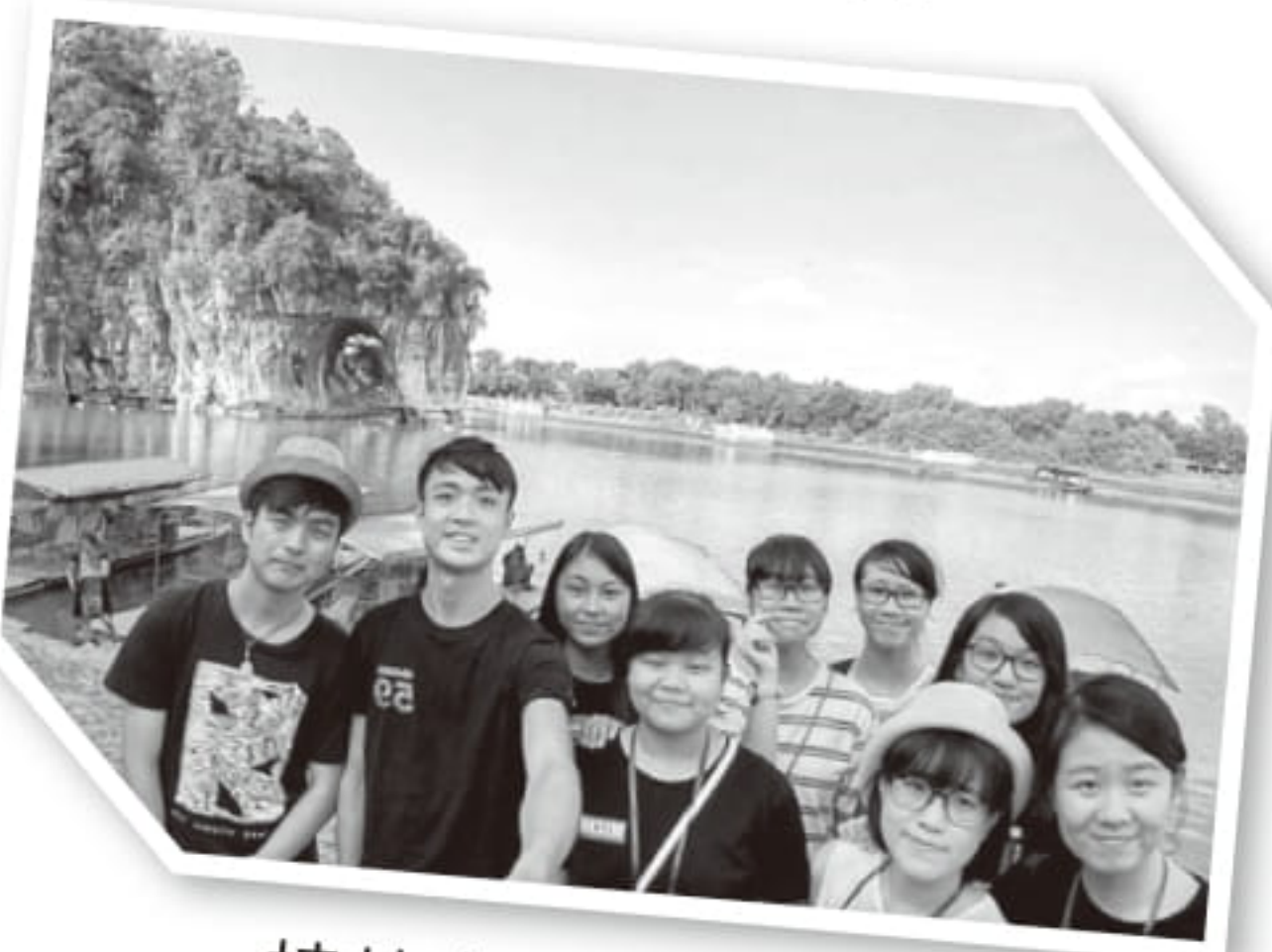
桂林山水盡收眼底