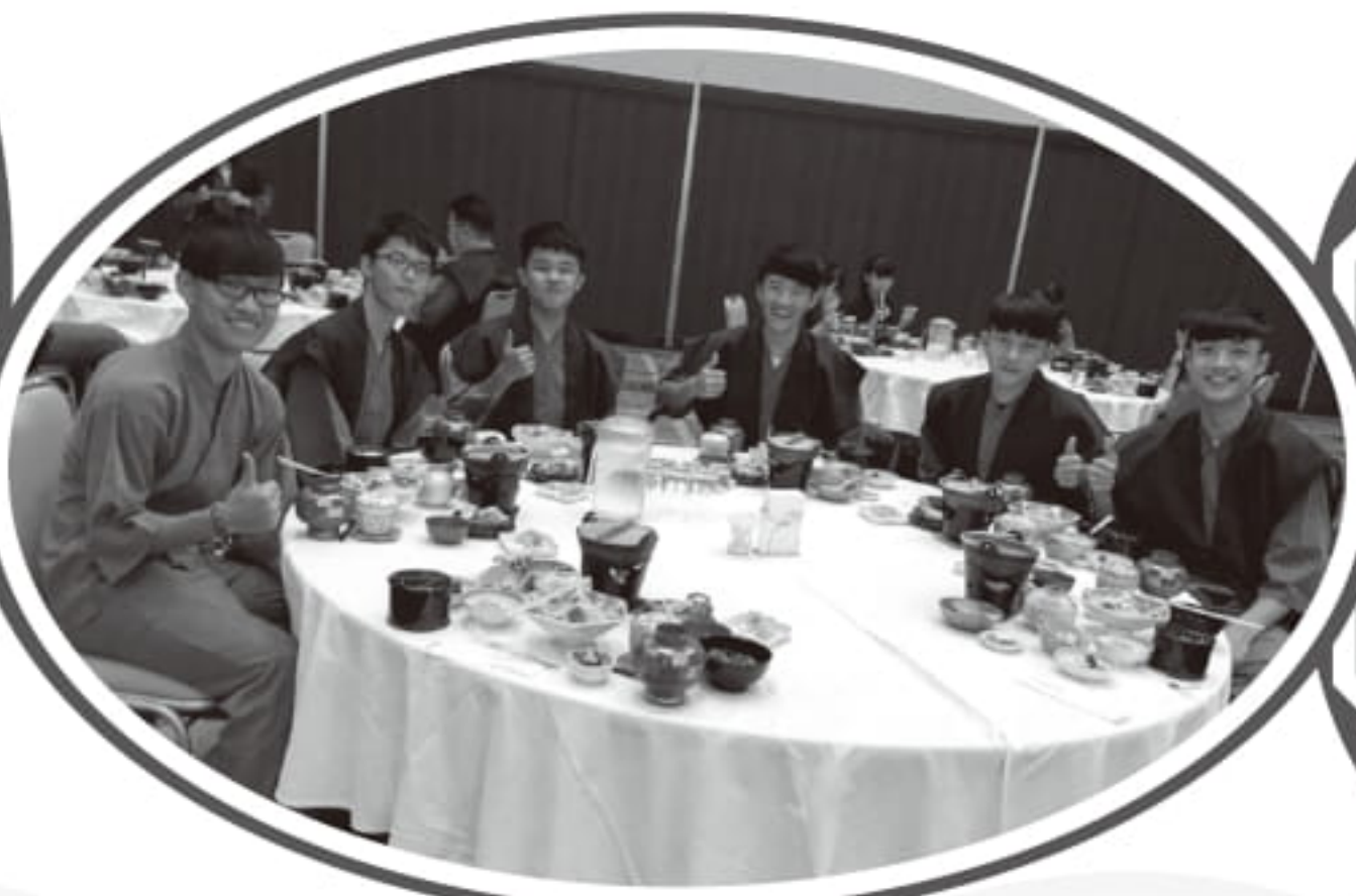
穿上浴衣參加宴會