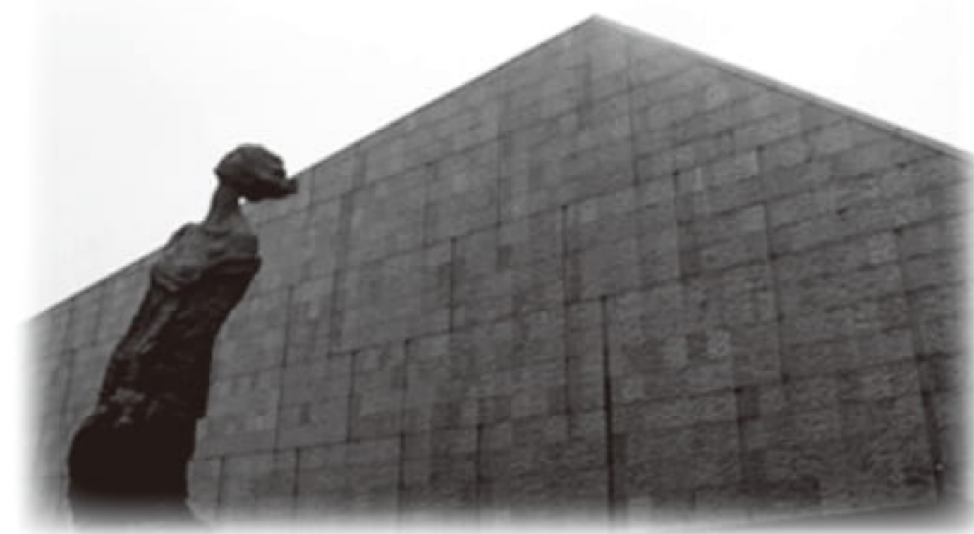
侵華日軍南京大屠殺遇難同胞紀念館門外

這趟旅程除了使我體驗、認識到南京這六朝古都的魅力，也使我對中國歷史有了更大的了解，可說是滿載而歸，期待有機會能再去一趟！