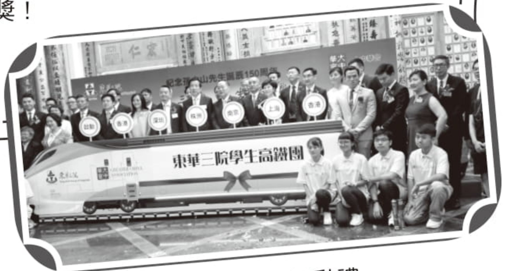
東華高鐵團啟動禮