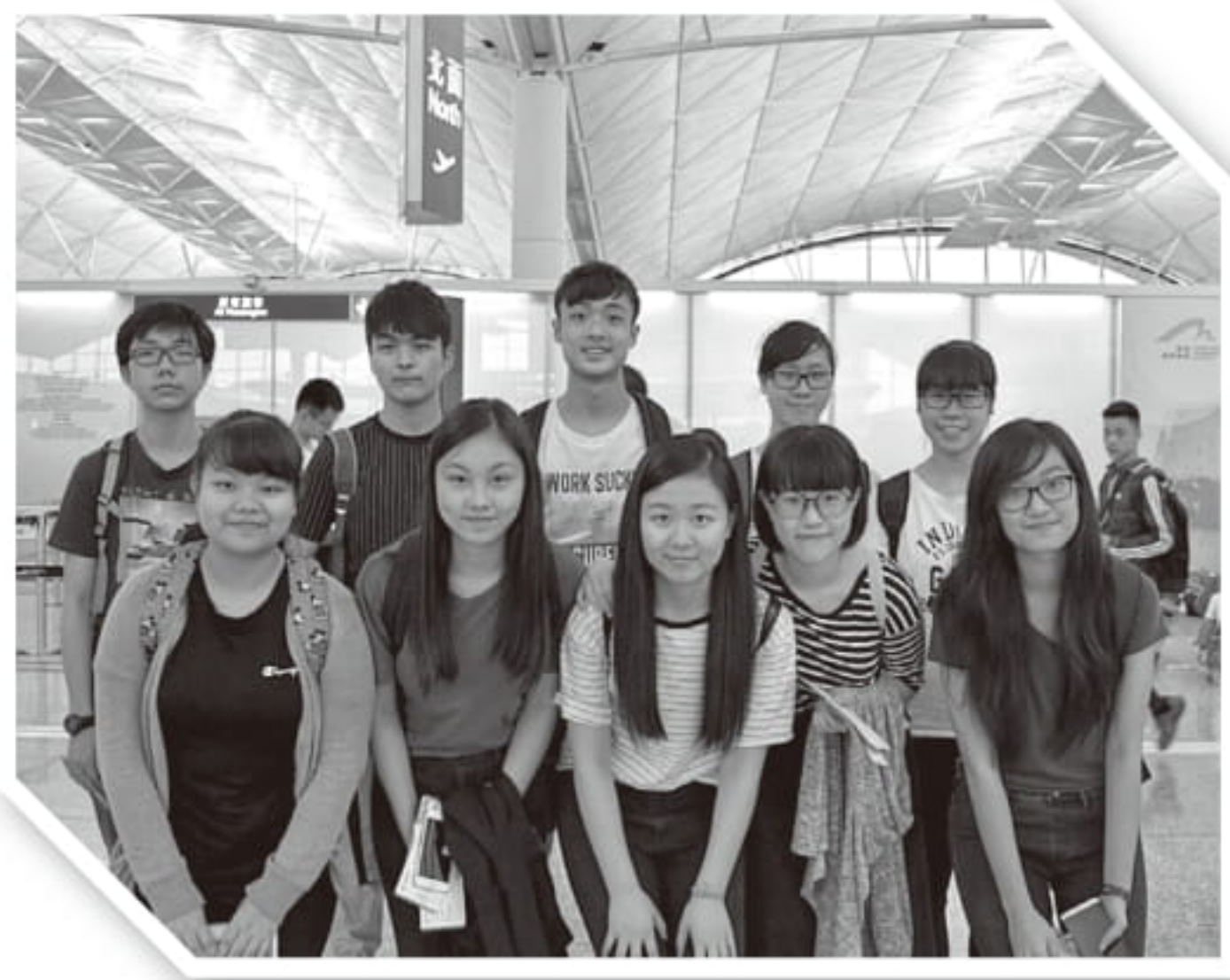
出發前盧中同學合照

暑假期間，本校8名升中四至中六同學，得到本院李銻麟副主席贊助，參加了由中國法學會舉辦的「香港與內地法律青年交流周」活動，交流團由2016年8月2日至8月7日在廣西桂林舉行。