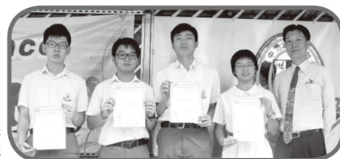
獲獎學生與林校長合影