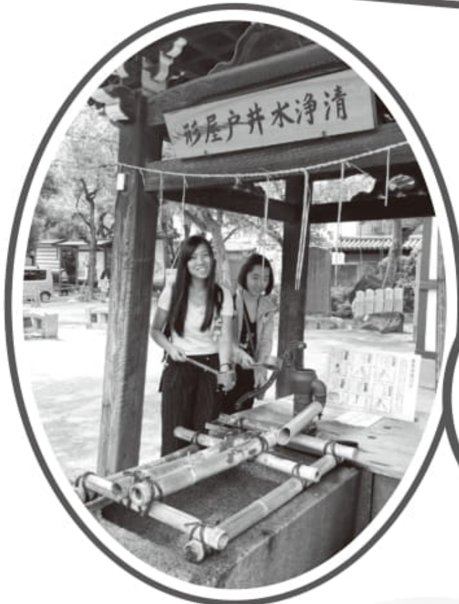
參拜四大天王寺前必須先洗淨雙手，以顯尊敬。