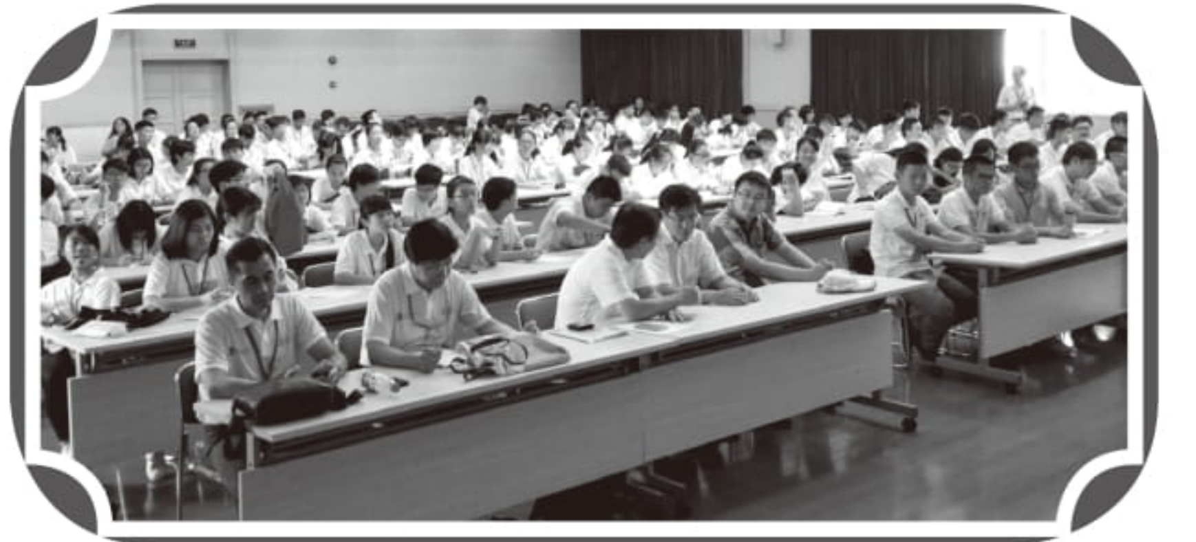
參與上海交通大學高鐵發展講座