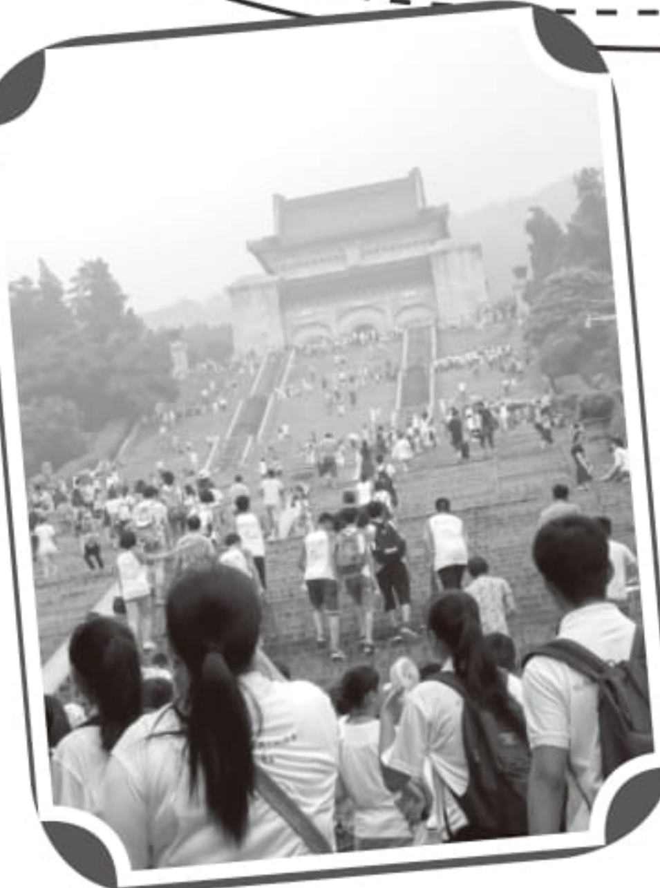
東華及上海閔行區同學一起謁中山陵

有朋自遠方來，不亦樂乎！青春結伴，同遊神州，其樂又進一層！經過五夜六天的相處，中港兩地姊妹學校同學結下了深厚的情誼。