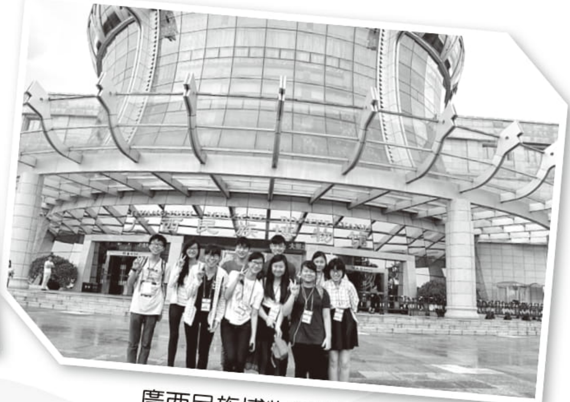
廣西民族博物館前留影