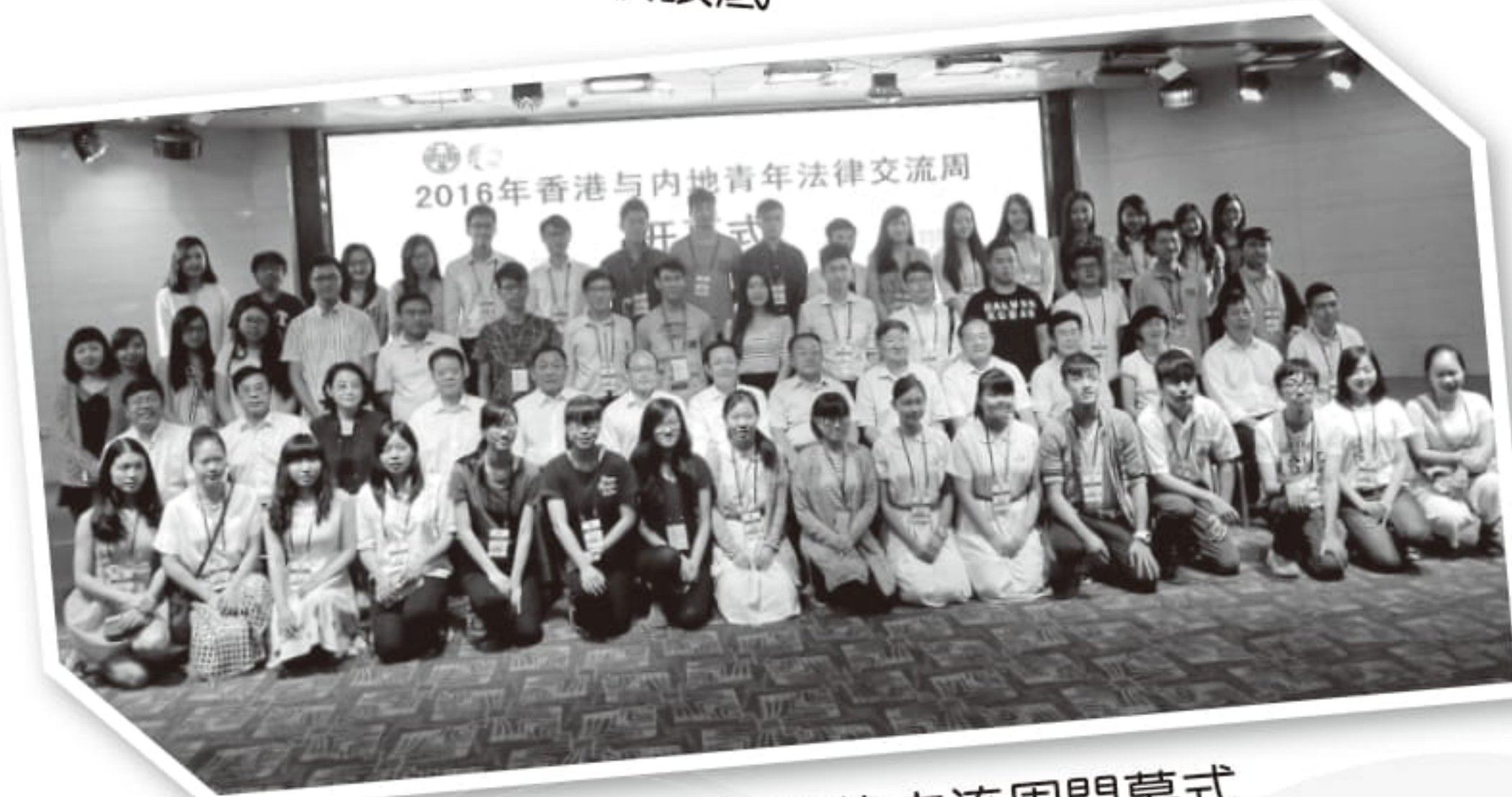
香港與內地青年法律交流周開幕式