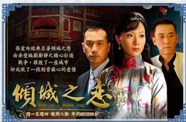
作品常被改編成不同電影、話劇